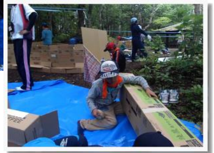
個性的な基地が完成!