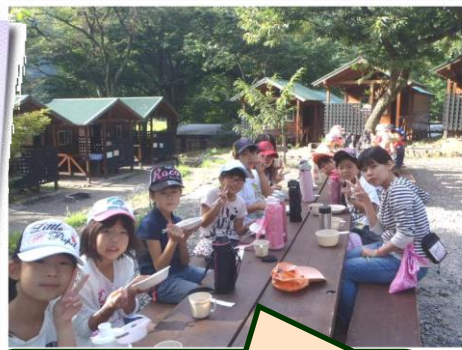
みんなが泊まるバンガロー。 外で食べる食事は美味しいよ!