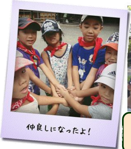
仲良しになったよ!

郡上八幡自然園は緑豊かな自然の中。カウンセラーや新しいお友達と一緒に過ごす2日間はきっと楽しいよ!