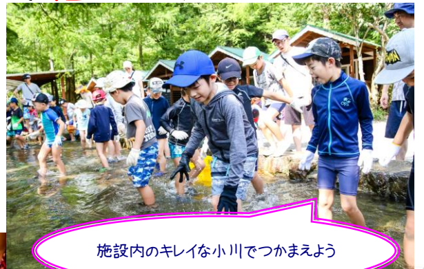
施設内のキレイな小川でつかまえよう