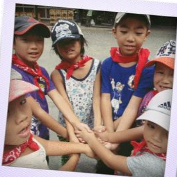
仲良しになったよ!

郡上八幡自然園は緑豊かな自然の中。カウンセラーや新しいお友達と一緒に過ごす2日間はきっと楽しいよ!