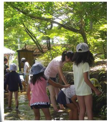
施設内のキレイな小川でつかまえよう