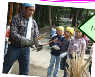
たき木を準備して...