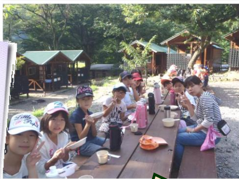
みんなが泊まるバンガロー。外で食べる食事は美味しいよ!