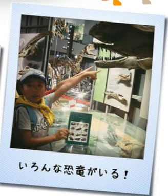
いろいろな恐竜がいる!