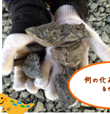
何の化石が出てくるかな?