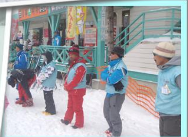
ほおのき平スキー学校の先生です。