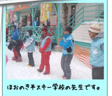
ほおのき平スキー学校の先生です。